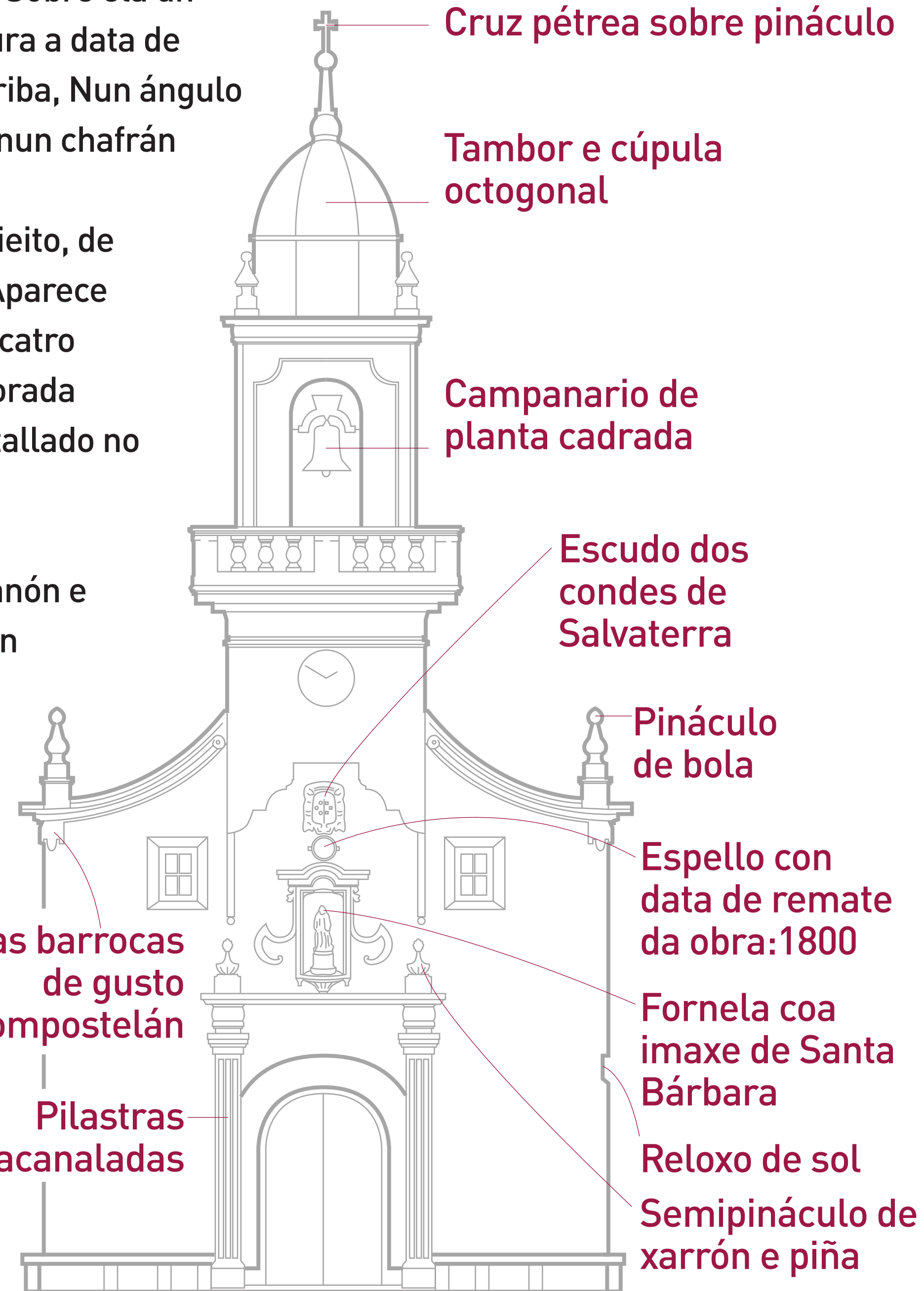
Placas barrocas de gusto compostelán