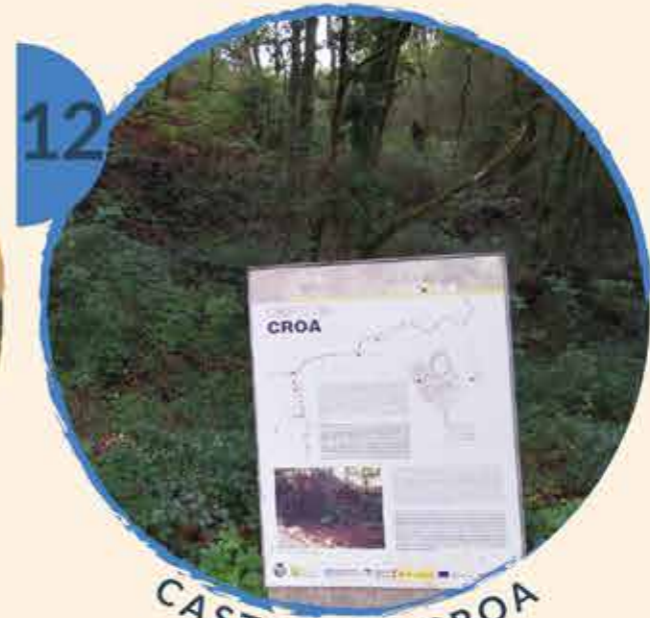
12 CASTRO DA CROA