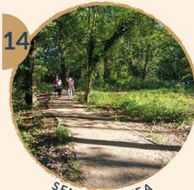
14 SENDA DO TEA