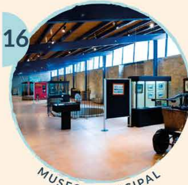
16 MUSEO MUNICIPAL