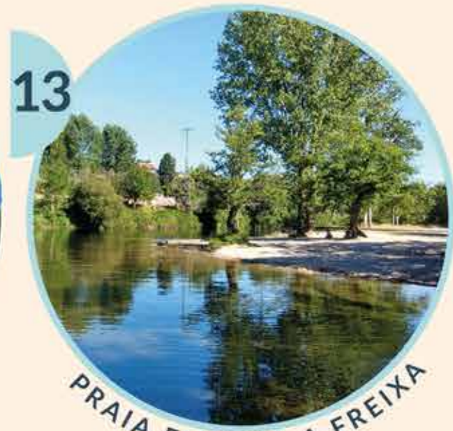
13 PRAIA FLUVIAL A FREIXA