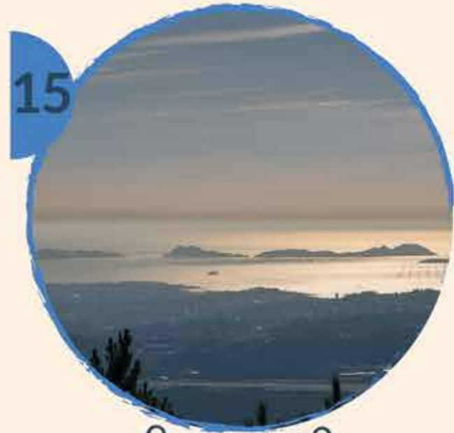
15 O GALLEIRO