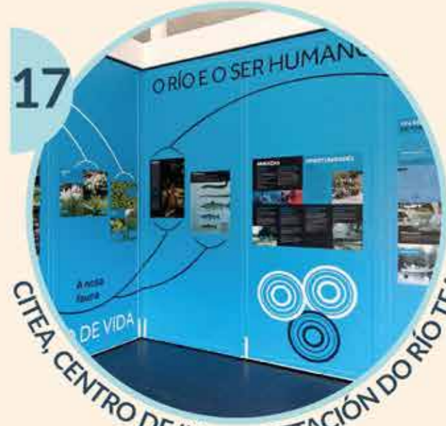
17 CITEA, CENTRO DE INTERPRETACIÓN DO RÍO TEA